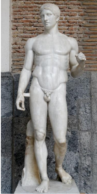
Polyklet: Doryphoros (Originalplastik 5. Jh. V. Chr.)