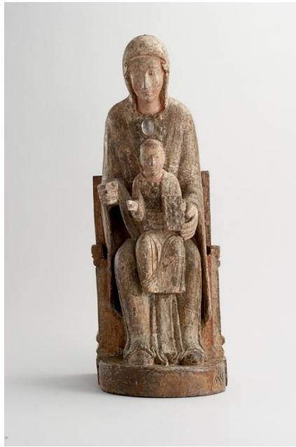
Thronende Muttergottes (um 1050)